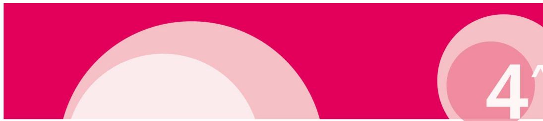
Immagine coordinata a cura di: Ufficio Comunicazione e servizi al cittadino - Comune di Udine - grafica: Francesca Teot